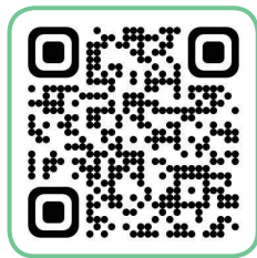
국립강릉원주대학교 유튜브 QR