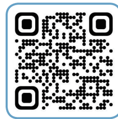
국립강릉원주대학교 홍보대사 인스타그램 QR