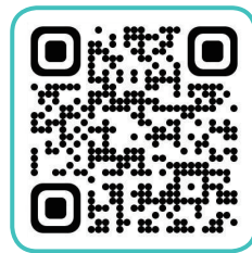
국립강릉원주대학교 공식 인스타그램 QR