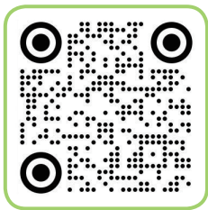
국립강릉원주대학교 입학과 홈페이지 QR